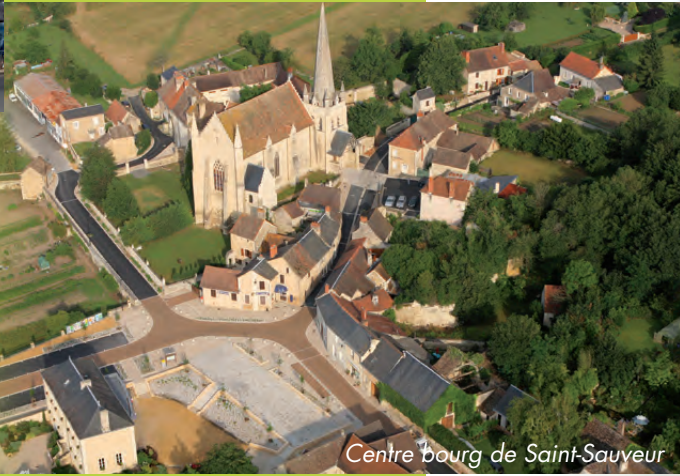
Centre bourg de Saint-Sauveur

Dès les années 70, la SEP intervenait dans la rénovation des centres anciens en particulier sur le secteur sauvegardé de Poitiers. Aujourd'hui, à Châtellerault, après avoir piloté les études permettant la création d'une ZPPAUP, elle accompagne la ville pour rénover et redynamiser son centre : DUP, acquisitions foncières, coordination, travaux d'embellissement, aide à l'information et la communication... Elle intervient aussi dans de petites