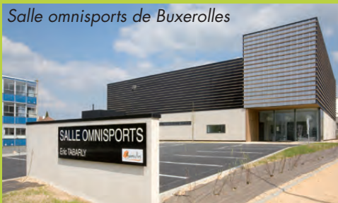
Salle omnisports de Buxerolles

Forte de deux certifications, conduite d'opérations et AMO technique, la SEP simplifie et sécurise l'ensemble du processus. Avec une équipe spécialisée en matière de construction HQE® et la mise en place d'une méthode pragmatique reposant sur un carnet de bord balisé et sécurisé, elle va accompagner et informer son client à chaque étape du projet jusqu'à sa livraison en apportant sa garantie de bonnes fins.