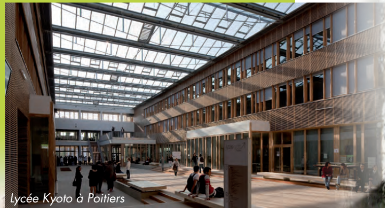
Lycée Kyoto à Poitiers

Aujourd'hui, l'acte de construire doit être pensé en terme de développement durable. La collectivité ou le client privé est alors confronté à une multitude de normes et à une pléiade d'interlocuteurs.