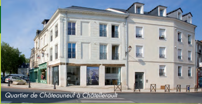
Quartier de Châteauneuf à Châtellerault